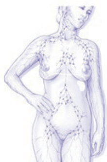
○ Lymfeknoop of lymfeklier — Lymfevat

U bent recent geopereerd aan de borst en oksel in ons ziekenhuis. Als u na het lezen van deze brochure nog vragen, problemen en/of onduidelijkheden heeft, kan u deze noteren en voorleggen bij het volgende contact met uw arts, kinesitherapeut of borstverpleegkundige.